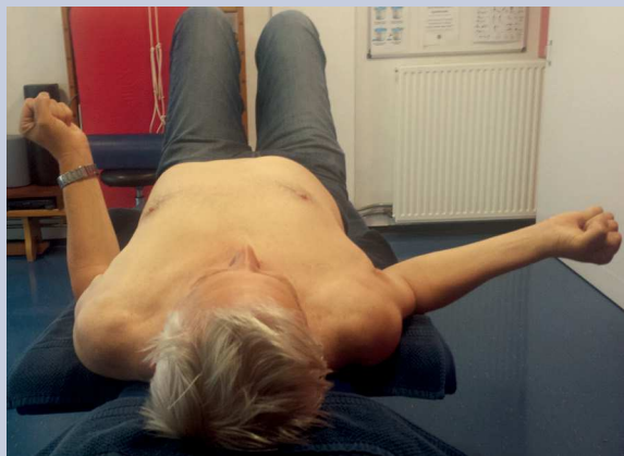
Man, 65, FS L, frozen fase, matige/lage reactiviteit, richtlijn-profiel II – exorotatie in rugligging: circumductie positie 1 met gebalde vuisten, ter facilitatie van het 'gecentreerd' bewegen in de richting van positie 2, de Close Packed Position

Mate van bewegingsbeperking tijdens het FS-traject Door bij matige en vooral lage reactiviteit zeer frequent 'gecentreerd' te bewegen naar eindstanden op geleide van de '24 uur-regel', neemt de ROM toe dankzij prikkeling van fibroblasten en het verbreken van niet-structurele crosslinks door Matrix Metallo Proteïnase.